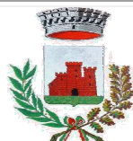
Comune di Castelcuoco