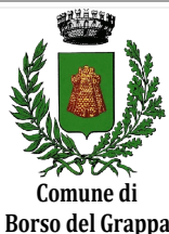
Comune di Borso del Grappa